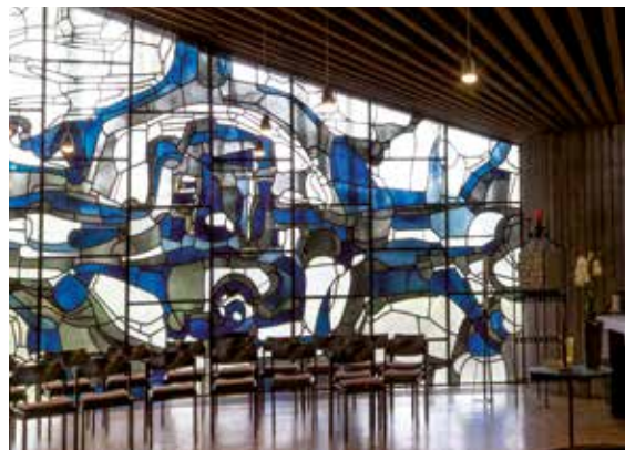
Kapelle der Wasserburg Rindern